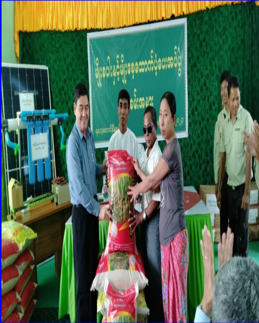
ရသေ့တောင်မြို့နယ် တောင်သူများသို့ မျိုးစပါးများ ကူညီထောက်ပံ့ခြင်း