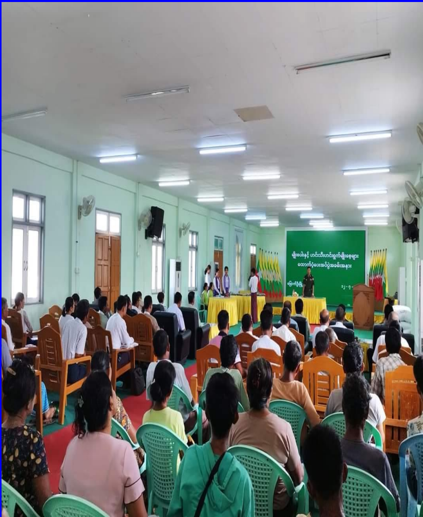
မြောက်ဦးမြို့နယ် တောင်သူများသို့ မျိုးစပါးများ ကူညီထောက်ပံ့ခြင်း