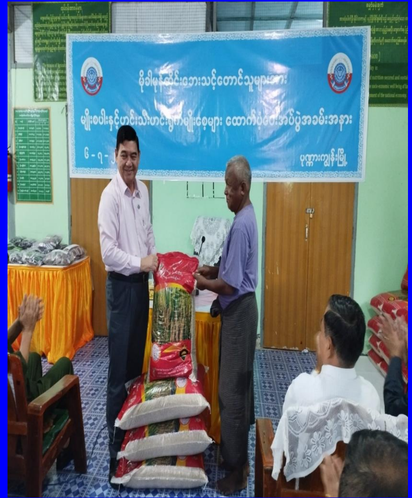
ပုဏ္ဏားကျွန်းမြို့နယ် တောင်သူများသို့ မျိုးစပါးများ ကူညီထောက်ပံ့ခြင်း