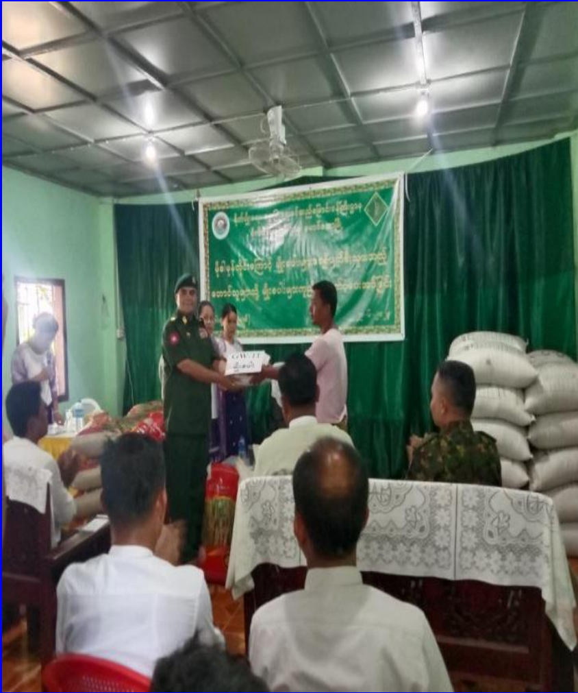
မောင်တောမြို့နယ် တောင်သူများသို့ မျိုးစပါးများ ကူညီထောက်ပံ့ခြင်း