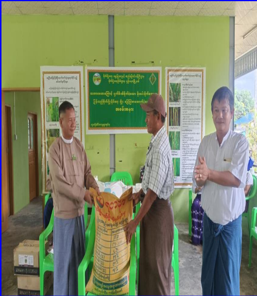
ပျဉ်းမနားမြို့နယ် MRF မှ ထောက်ပံ့ပေးသော မျိုးစပါးများအား လက်ခံရယူခြင်းနှင့် တောင်သူများသို့ဖြန့်ဝေခြင်း