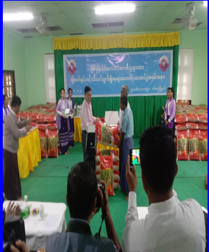
စစ်တွေမြို့နယ် တောင်သူများသို့ မျိုးစပါးများ ကူညီထောက်ပံ့ခြင်း