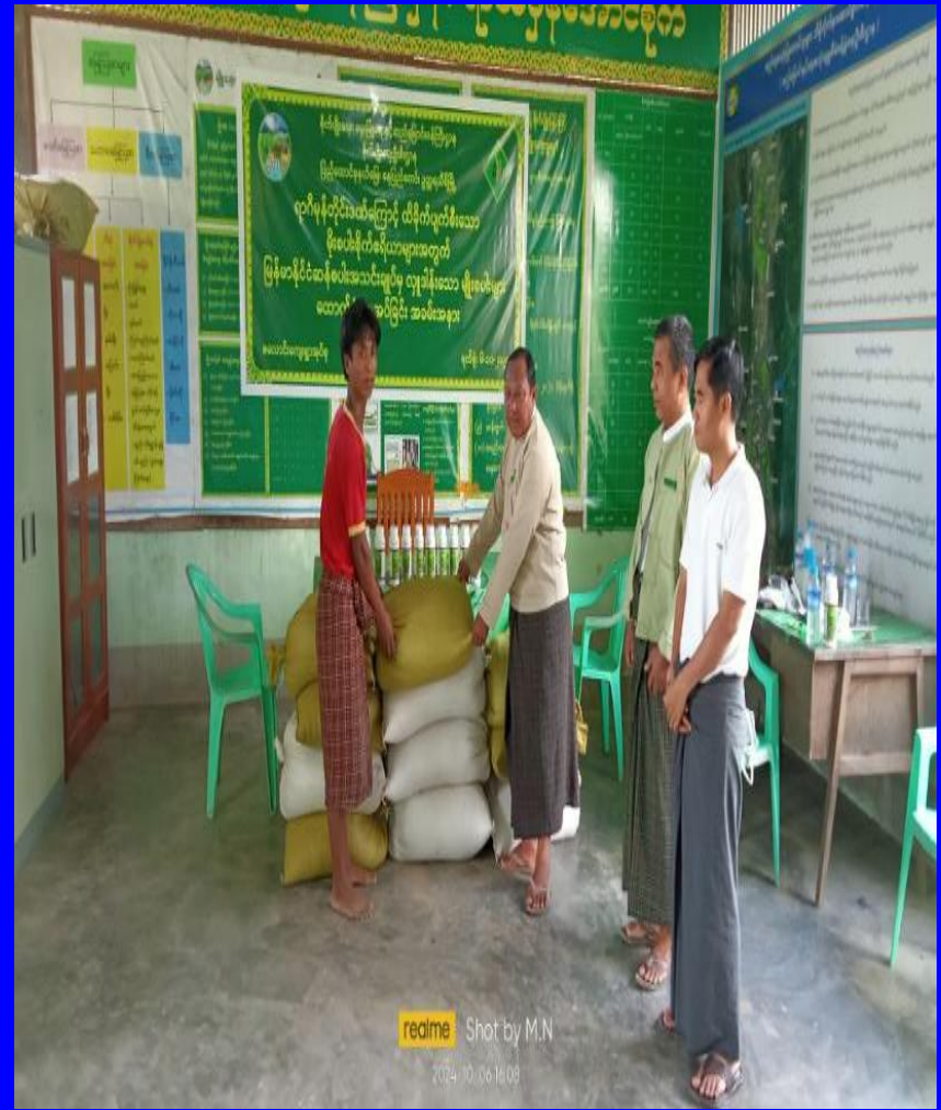
ဥတ္တရသီရိမြို့နယ် MRF မှ ထောက်ပံ့ပေးသော မျိုးစပါးများအား လက်ခံရယူခြင်းနှင့် တောင်သူများသို့ဖြန့်ဝေခြင်း