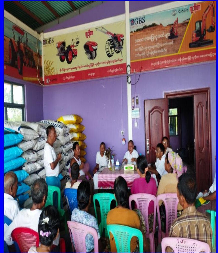
ကျောက်တော်မြို့နယ် တောင်သူများသို့ မျိုးစပါးများ ကူညီထောက်ပံ့ခြင်း