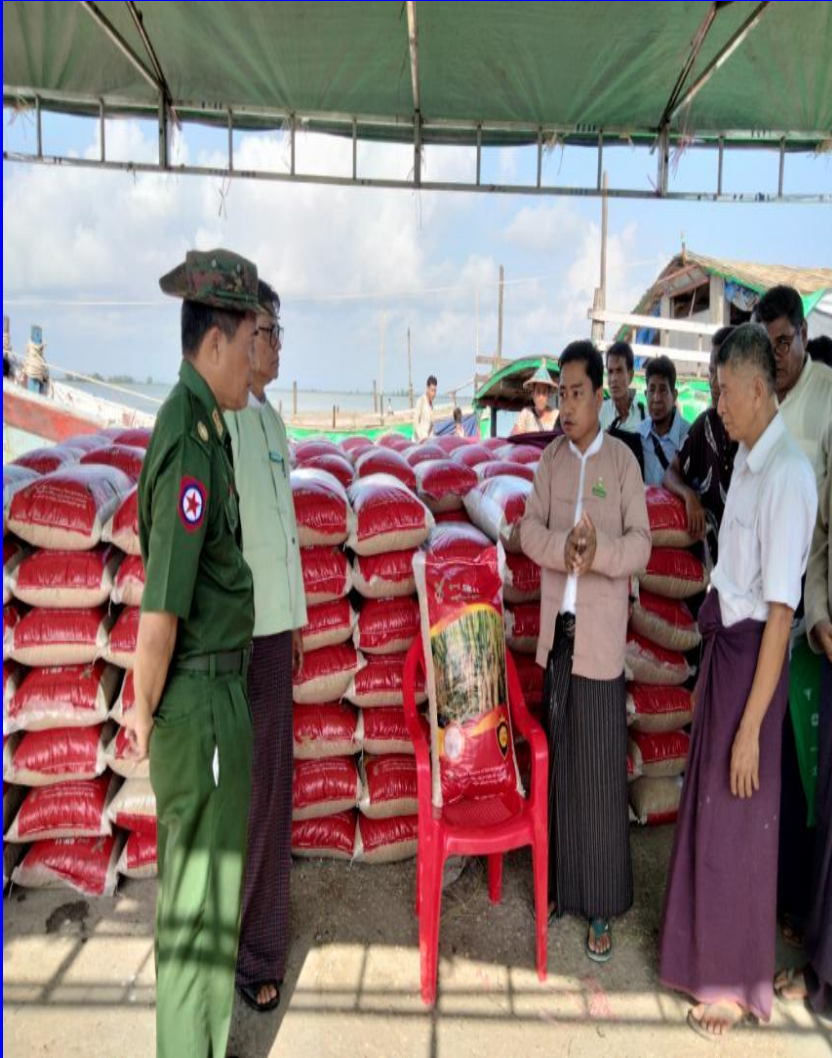
ပေါက်တောမြို့နယ် တောင်သူများသို့ မျိုးစပါးများ ကူညီထောက်ပံ့ခြင်း