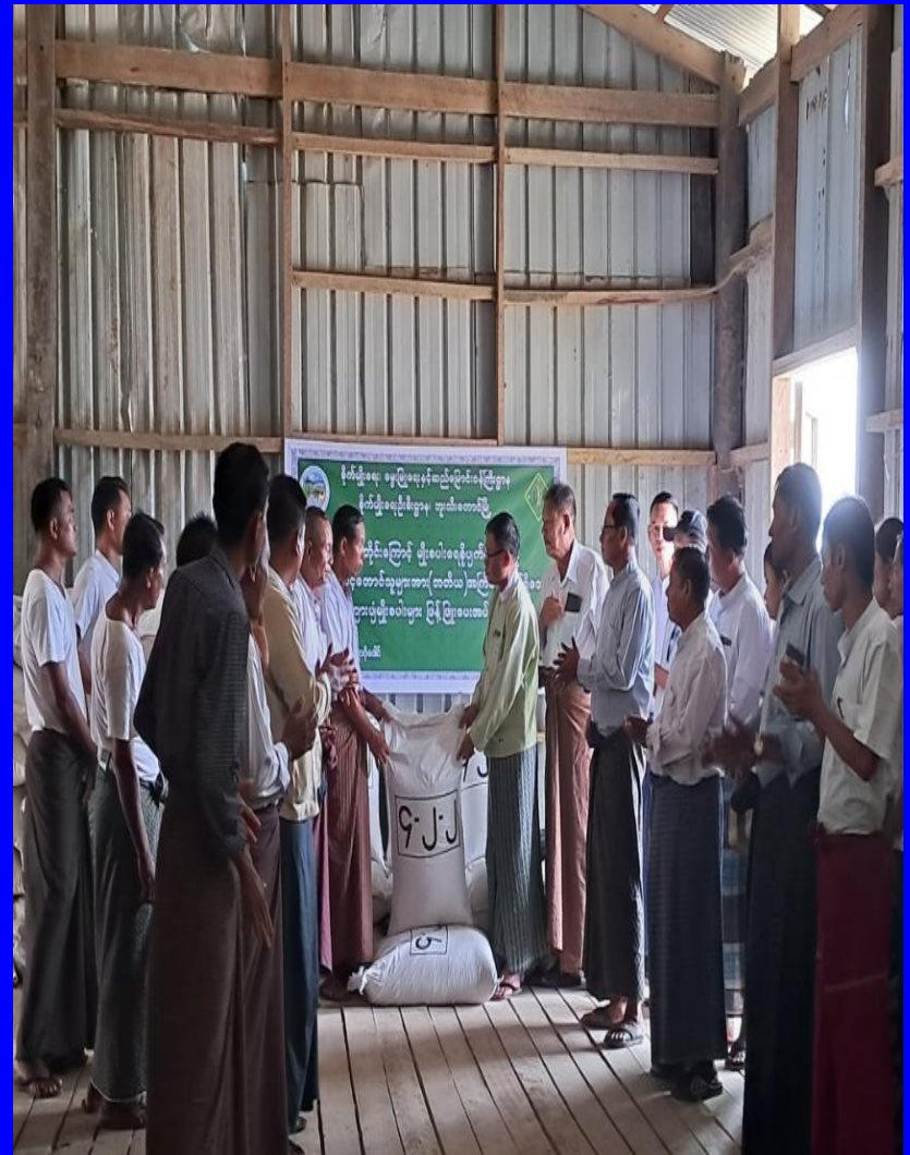
ဘူးသီးတောင်မြို့နယ် တောင်သူများသို့ မျိုးစပါးများ ကူညီထောက်ပံ့ခြင်း