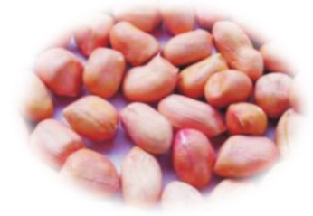
အခွံမပါမြေပဲလုံးဆံ

+ ကြိတ်ခွဲခြင်း (တန်ဖိုး ထည့်ပေါင်းခြင်း)