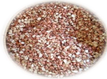
အခွံမပါမြေပဲ ဆီဆံ