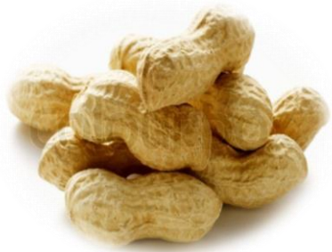
အခွံပါမြေပဲတောင့်

+ အခွံချွတ် လုပ်ငန်းစဉ် (တန်ဖိုး ထည့်ပေါင်းခြင်း)