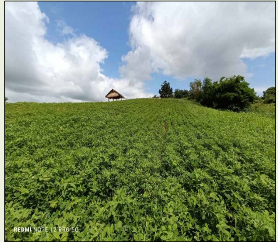
ကူဆည်စုအုပ်စု၊ ကွင်းအမှတ် (၁၈၆၁က)