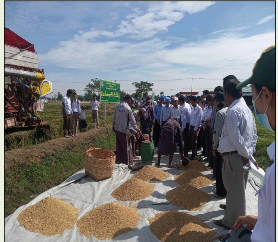
ရွာမအုပ်စု၊ ကွင်းအမှတ်(၁၆၇၂)