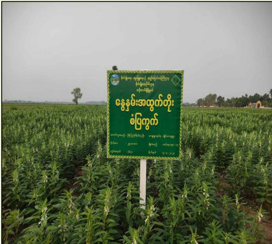
ချိုင်းအုပ်စု၊ ကွင်းအမှတ်(၁၆၇၁)