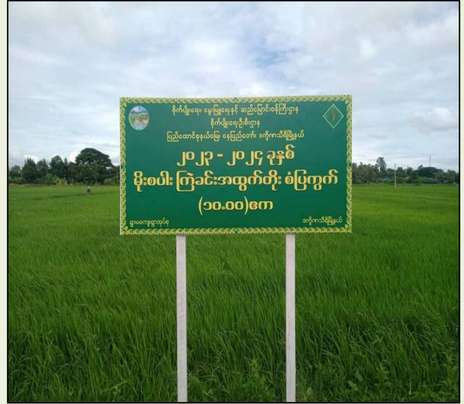
ရွာမအုပ်စု၊ ကွင်းအမှတ် (၁၆၇၂)