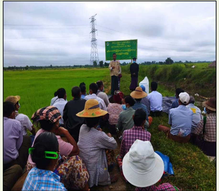
ကူဆည်စုအုပ်စု၊ကွင်းအမှတ်(၁၈၆၁က)