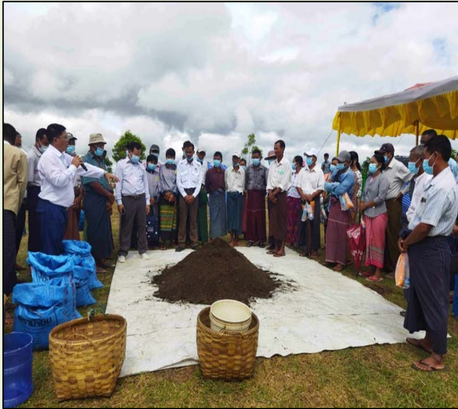
ရွာမအုပ်စု၊ကွင်းအမှတ်(၁၆၇၂)