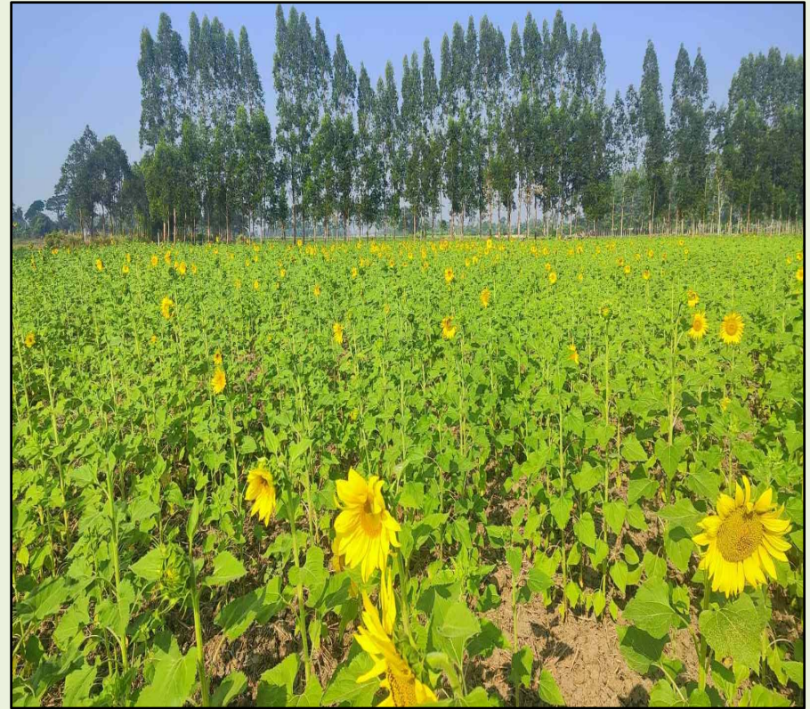
ချိုင်းအုပ်စု၊ ကွင်းအမှတ် (၁၆၇၀)