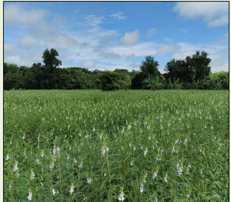
ရွှေခဲအင်းအုပ်စု၊ ကွင်းအမှတ်(၂၁၃၇)