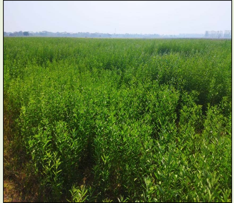
ရွှေခဲအင်းအုပ်စု၊ သစ်တောကွင်း