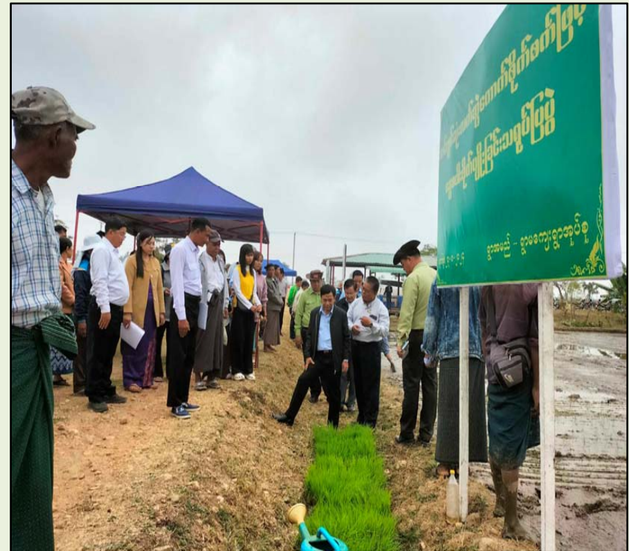
ရွာမအုပ်စု၊ ကွင်းအမှတ်(၁၆၇၂)