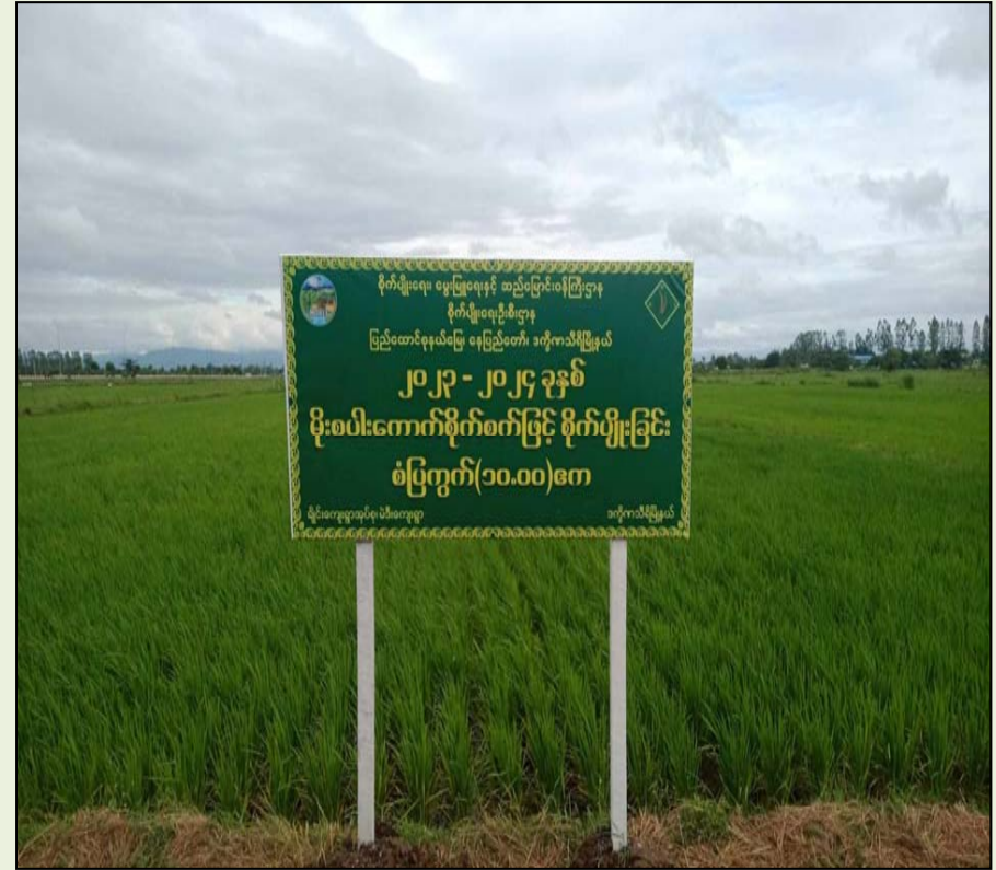
ချိုင်းအုပ်စု၊ ကွင်းအမှတ်(၁၆၇၁)