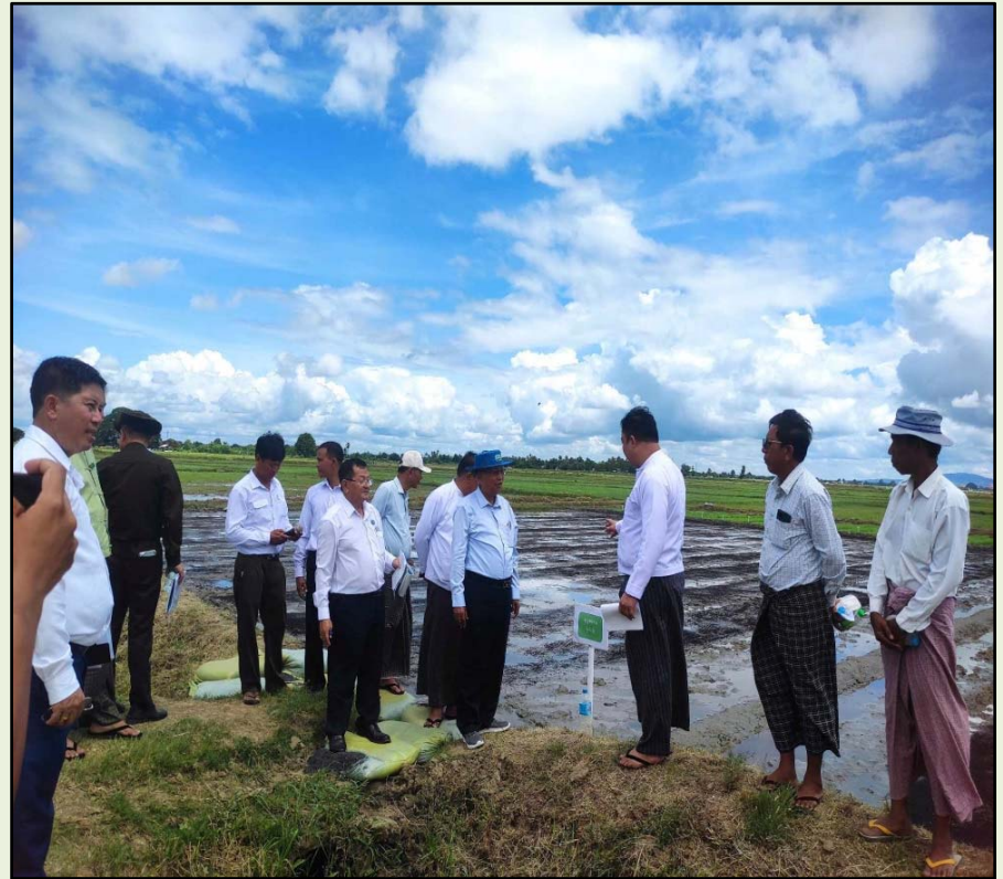
ရွာမအုပ်စု၊ကွင်းအမှတ်(၁၆၇၂)