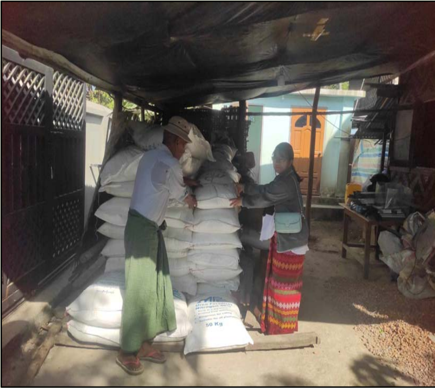
ချိုင်းအုပ်စု၊ချိုင်းကျေးရွာအုပ်ချုပ်ရေးမှူးရုံး