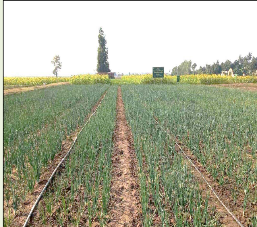
ချိုင်းအုပ်စု၊ ကွင်းအမှတ်(၁၆၇၁)