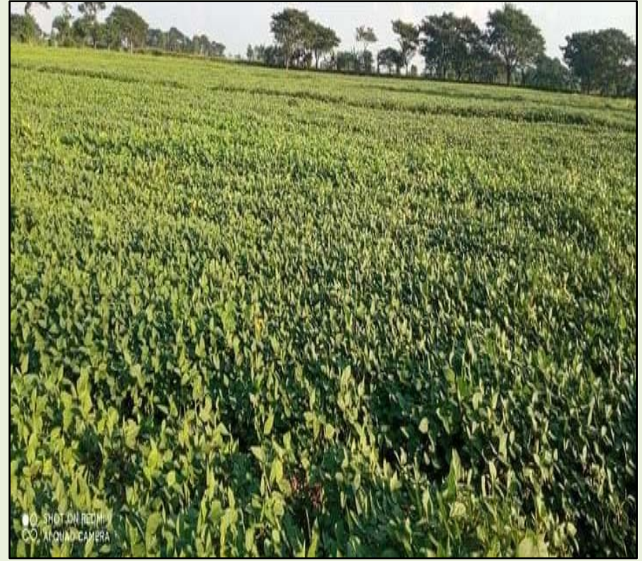
ရွှေခဲအင်းအုပ်စု၊ ကွင်းအမှတ် (၂၀၃၆)