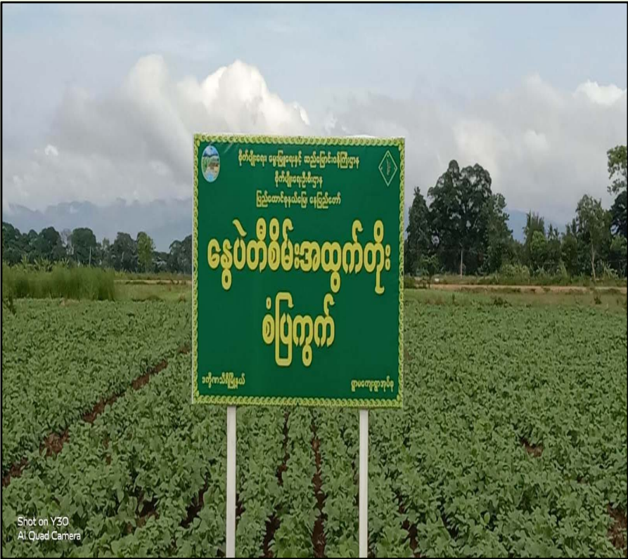
ရွာမအုပ်စု၊ ကွင်းအမှတ်(၁၆၇၂)