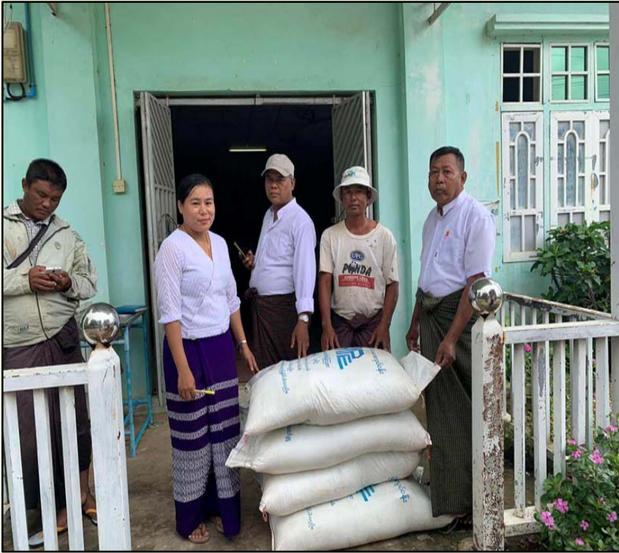
ကြာပင်အုပ်စု၊ထန်းတပင်ကျေးရွာSMUခန်းမ